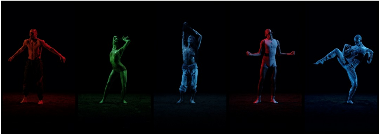
Tobias Staab: Trans Corporal Formations

Ein weiterer Höhepunkt wird die digitale DANCE History Tour sein, die künstlerische Demonstrationen der Elizabeth-Duncan-Schule und des Bayerischen Junior Balletts München einschließt.